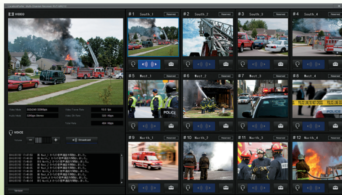
RVT-MR212の受信画面(シーン画像はハメコミ合成です)