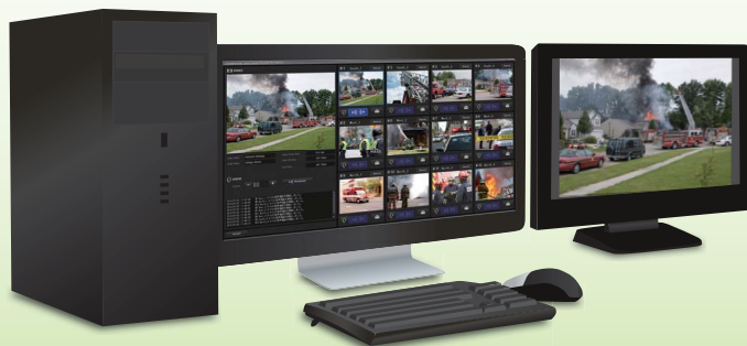
※商品イメージのイラストです。PCモニターおよびビデオモニターは別売です。

各種のモバイル回線に対応し、 最大12地点とのリアルタイム映像伝送を実現する モバイル中継システム“ロケーションポーター”マルチチャンネルレシーバー