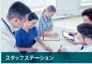
スタッフステーション