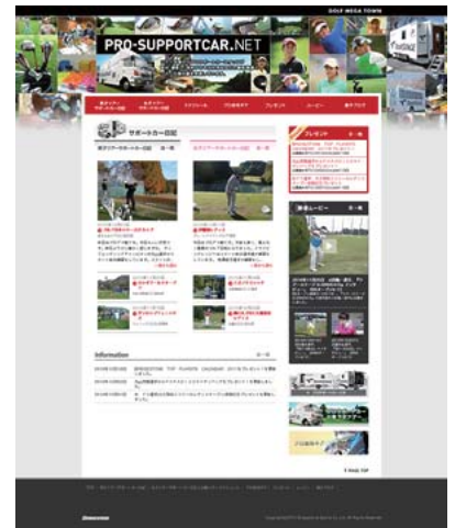
トーナメントのレポートを掲載するサイト 「プロサポートカーネット」 http://www.pro-supportcar.net/

千藏 | プリチストンスポーツセールスジャパンでは、業務内容によっては長期出張もあり、一度会社を出たら一週間くらい戻らないことも珍しくありません。その間は宿泊するホテルで、グループウェアやワークフローのシステムにアクセスして、社内にいるときと同じような密な情報共有をしています。彼らの業務にはGシリーズが最適なようです。本体には書き込み可能なDVDドライブも付いていますし、ACアダプターもコンパクト。VAIOさえあればやりたいことはでき、しかもPC本体が軽くて、備品も小さく、持ち運びしやすいわけですから。長期出張になると荷物や書類なども増えるので、VAIOが軽くて小さいことはうれしいようです。