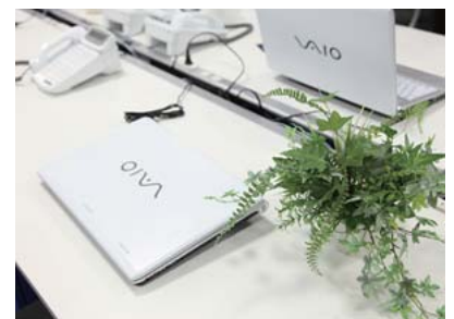
ホワइटのVAIOが、デスクを明るく、清潔感のある印象に

それから導入時の設定は5人の社員で対応しましたが、台数が多くて時間と手間がかかってしまいました。その負担を減らすために、次の機会にはVAIOのビジネスサービスを使って、オンサイトでのキッティングサービスを検討したいと思っています。