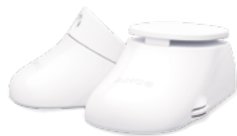
ベビーシューズを思わせるデザイン

受信機は大きさ約51.1mm(幅)×99.1mm(高さ)×36.1mm(奥行き)*、質量約100gの小型タイプ。内蔵充電電池でも使用できるので持ち歩きが可能です。ベルトクリップでベルトに取り付けられれば、家事などの際にも便利です。 *スタンドを閉じた時