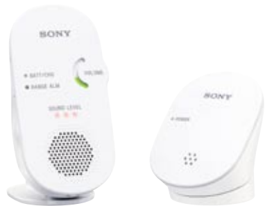
デジタル音声ベビーモニター NTM-DA1 オープン価格 [付属品] ACアダプター