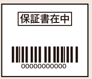
※アクセサリのパッケージはこちらを切り取ってください。