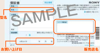
お買い上げ日 販売店名

原本は大切に保管し、必ずコピーを貼り付けてください。原本を送られた場合でも返送されません。 ※ 適宜折りたたんで貼り付けてください。 ※ 販売店が発行する保証書などのみでの応募は無効となります。