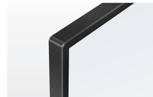
メタルでフラットな形状